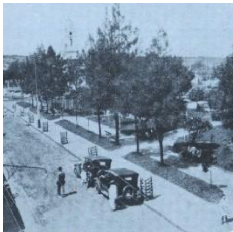
Trecho da Rua Bernardino de Campos, vendo-se parte da Praça Ruy Barbosa.