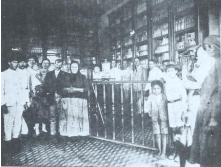
Interior da Pharmacia Nossa Senhora do Carmo