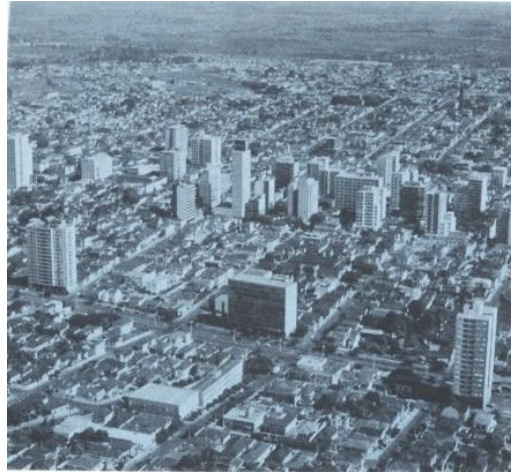
Vista aérea da cidade de São José do Rio Preto